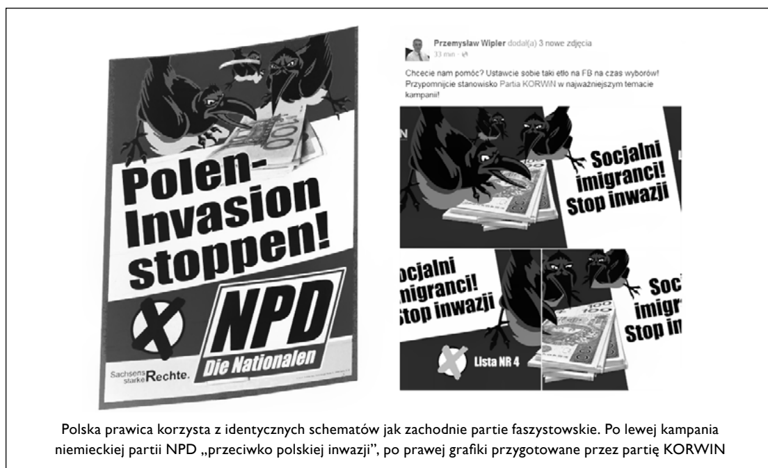
Polska prawica korzysta z identycznych schematów jak zachodnie partie faszystowskie. Po lewej kampania niemieckiej partii NPD „przeciwko polskiej inwazji”, po prawej grafiki przygotowane przez partię KORWIN

2. Aktywnie wspierajmy te organizacje społeczne, które w regionie Bliskiego Wschodu przeciwstawiają się fanatyzmowi religijnemu. Najlepszym przykładem jest tu społeczność kurdyjska, która powstrzymała tegoroczną ofensywę ISIS i stworzyła na kontrolowanych przez siebie regionach Syrii samorząd oparty o demo-