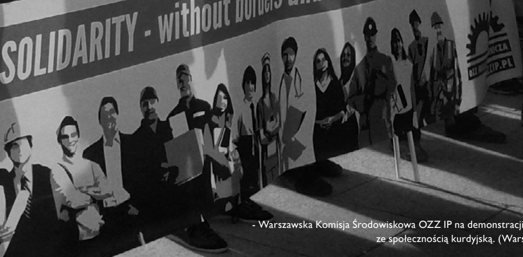
- Warszawska Komisja Środowiskowa OZZ IP na demonstracji solidarnościowej ze społecznością kurdyjską. (Warszawa lipiec 2015)

SOLIDARITY - without borders and divides