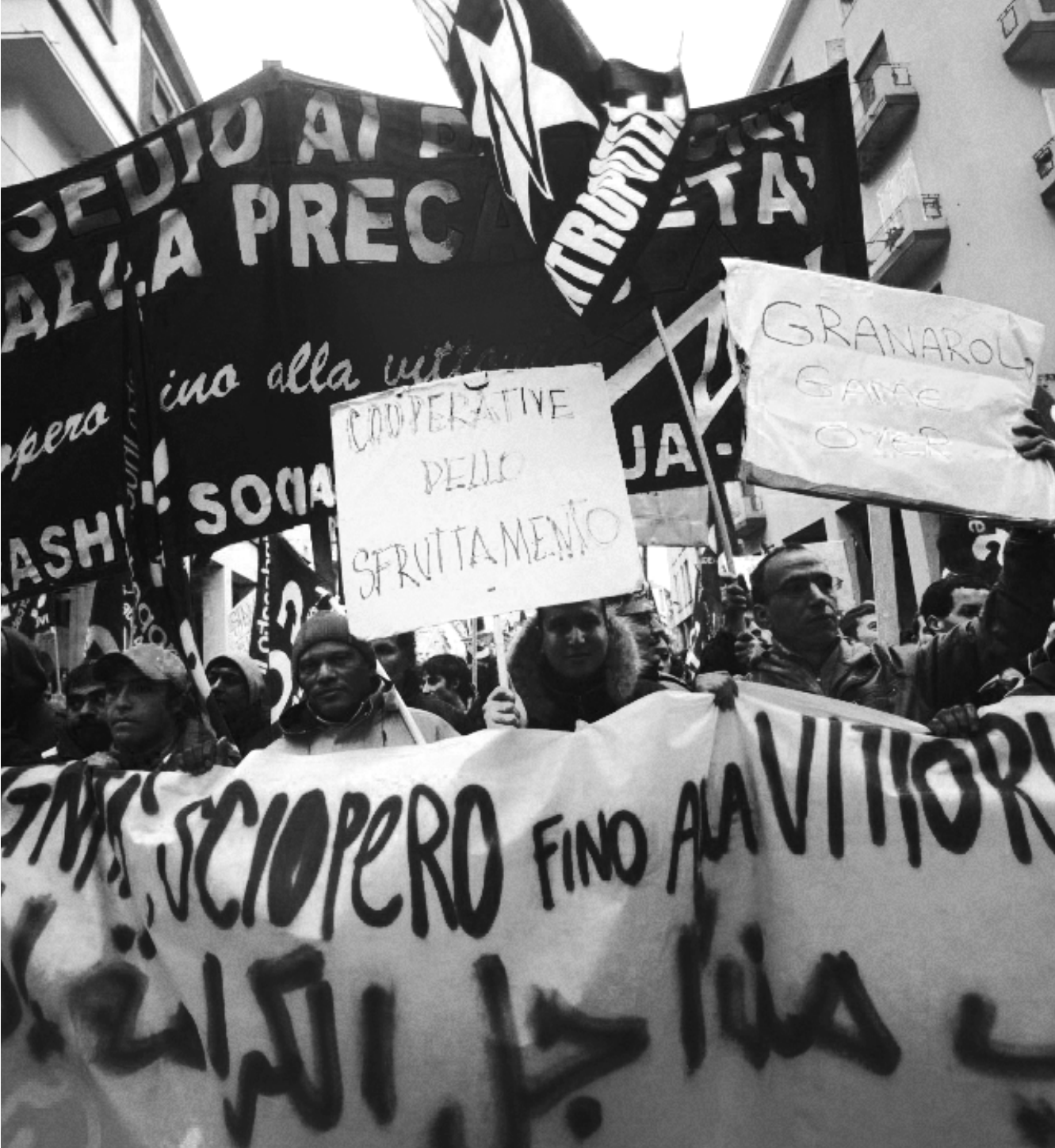
Demonstracja SI COBAS w Bolonii luty 2014

Zaczął budować radykalny ruch, nie tylko w logistyce. Pracownicy logistyki często biorą udział w demonstracjach na rzecz praw lokatorów i lokatek i wspierają walki innych branż. Nie skupiają się wyłącznie na sektorze logistycznym. Teraz wspierają pracowników sektora metalowego, a wcześniej pomagali personelowi hoteli.