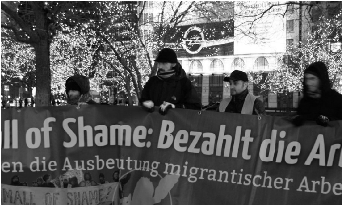
FAU Berlin z transparentem domagającym się zapłaty zaległych wynagrodzeń dla pracowników budujących Mall of Berlin