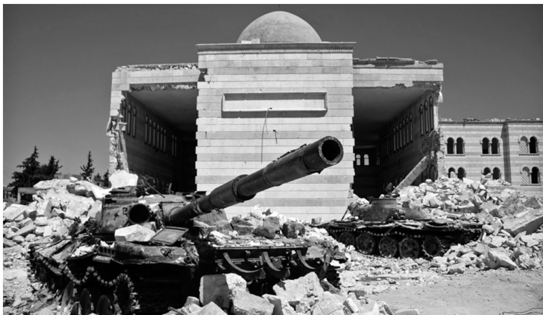
Efekty wojny domowej: zniszczony meczet w Azaz w syryjskiej prowincji Aleppo

2 015 rok przyniósł Europie największy od lat 90-tych kryzys migracyjny. Jak szacuje UNHCR (Biuro Wysokiego Komisarza ONZ ds. Uchodźców), od początku roku do Europy przybyło ponad 700 tys. osób uciekających głównie z Syrii, Afganistanu i Iraku. Jest to mniej więcej czterokrotnie więcej niż w roku 2014. Reakcje na ten wzrost liczby uchodźców i uchodźczyń były i są pełne obaw. Choć teoretycznie respektowanie praw